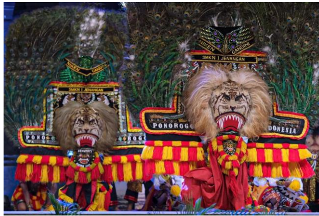
Gambar 3. Reog Ponorogo

Beberapa event yang paling dikenal dan digunakan sebagai event kirab adalah reog ponorogo. Bahkan kesenian tersebut sudah dikenal sampai dengan mancanegara. Adapun perayaan dari reog ponorogo ini dilakukan acara rutin pada tahun baru islam ataupun menjelang 1 muharram. Budaya dari kesenian reog ponorogo ini harus dilestarikan dan merupakan salah satu warisan budaya. Adanya event budaya tersebut juga mampu membuka lapangan pekerjaan dari beberapa sektor untuk negara, daerah, ataupun untuk masyarakat sekitar. Selain itu, perayaan dari event kirab budaya ini juga diselenggarakan pada event hajatan, gladi resik, dan lain sebagainya (Anggoro et al., 2023).