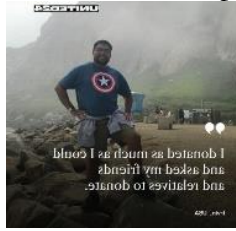
Gambar 5. Foto berpose