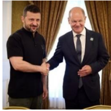
Gambar 3. Foto sedang berjabat tangan