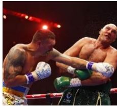
Gambar 4. Foto sedang bertinju