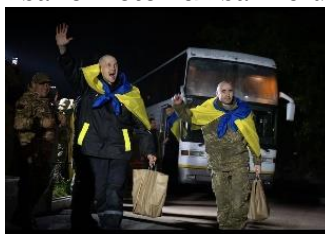
Gambar 8. Foto kembali kerumah

sumber: Instagram @zelenskyy_official (diunggah pada 19 Oktober 2024) Caption: “At home”