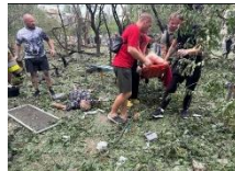
Gambar 6. Foto bermain