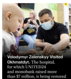
Gambar 2. Foto sednag mengunjungi anak

Caption: “We are grateful to everyone who contributed to the fundraiser for the restoration of @ohmatdyt. We thank everyone who donated, supported children, helped clear the rubble and are restoring hospital operations. We believe that by working together we can make the facility even better than before the attack”