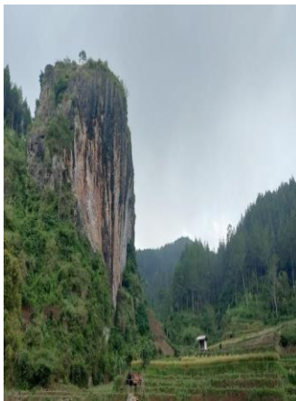
Gambar 1 Watu Semaun

Watu Semaun ini terletak dipinggir jalan raya Ngrayun-Jajar tepatnya di Desa Selur Kecamatan Ngrayun Yakni, sebuah tebing batu besar yang berada di tengah-tengah padang rumput. Tebing batu ini oleh warga setempat kemudian dinamakan Watu Semaun, karena jika ada orang berteriak akan menggema seperti berteriak di dalam gua. Watu Semaun juga sering dimanfaatkan oleh para penghobi olah raga panjat tebing atau climbing. Karena, mempunyai ketinggian sekitar 125 meter, sehingga sangat cocok untuk mengadu nyali menaklukkan ketinggian tebing ini. Jika musim kemarau, area disekitar Watu Semaun sering dijadikan tempat berkemah. Banyak pengunjung yang sengaja berkemah disini untuk menikmati keindahan Watu Semaun sambil panjat tebing. Mereka berasal dari Ponorogo, Madiun, Magetan dan banyak jugadari Surabaya serta kota-kota lainnya (Adi Nugroho, 2023)