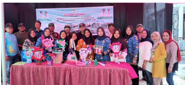
Gambar 1. Bentuk Pemberdayaan Perempuan Melalui Probebaya