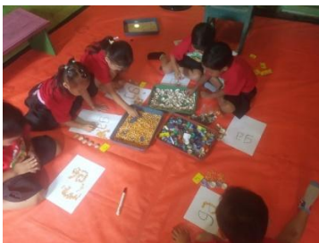
Gambar 5. Anak-anak membuat kerajinan

Keterlibatan lembaga dalam kegiatan sosial masyarakat juga menjadi ciri khas KB Lesung Jumengglung. Lembaga ini aktif mengikuti kegiatan kemasyarakatan, seperti peringatan Hari Kemerdekaan 17 Agustus dan acara haul desa. Dalam kegiatan karnaval desa, anak-anak turut serta menampilkan tarian atau pertunjukan kecil yang menumbuhkan rasa percaya diri dan cinta tanah air. Partisipasi aktif dalam kegiatan desa memperkuat hubungan sosial antara sekolah dan masyarakat, serta menumbuhkan semangat kebersamaan dan gotong royong (Agusriani & Fitri, 2024).