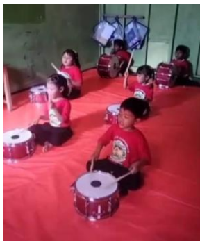
Gambar 3. Ekstrakurikuler Drum Band

KB Lesung Jumengglung melaksanakan proses pembelajaran dengan menggunakan Kurikulum Merdeka sesuai dengan ketentuan yang berlaku. Setiap kegiatan dirancang untuk memberikan pengalaman belajar yang bermakna melalui bermain sambil belajar, dengan melibatkan unsur eksplorasi, kreativitas, dan pengembangan karakter (Hidayah et al. , 2025). Selain kegiatan inti di dalam kelas, lembaga ini juga menyediakan berbagai program unggulan yang bertujuan memperkaya pengalaman belajar anak serta memperkuat hubungan antara sekolah, keluarga, dan masyarakat.