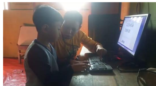
Gambar 4. Ekstrakurikuler Komputer

band. Kegiatan komputer dilaksanakan setiap hari Jumat, dengan tujuan memperkenalkan anak pada literasi digital secara sederhana. Sementara kegiatan drum band yang diadakan setiap Sabtu berfungsi untuk melatih koordinasi motorik, kekompakan, serta rasa percaya diri anak saat tampil di depan umum. Melalui kedua kegiatan tersebut, anak-anak belajar mengekspresikan diri dan mengembangkan kemampuan sosial secara alami. Kegiatan ekstrakurikuler pada anak usia dini berperan penting dalam mengembangkan keterampilan sosial, motorik, dan kepercayaan diri anak (Ramadhanti et al. 2025).