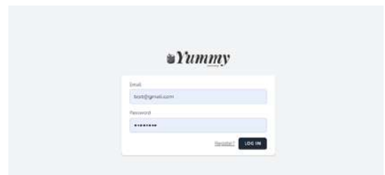
Gambar 1. Halaman Login

Tahap implementasi merupakan tahap dimana proses membangun sistem akan dilaksanakan sesuai dengan rancangan dan desain yang telah dibuat. Tampilan implementasi desain pada website terdapat pada gambar 1 yang menampilkan halaman utama yaitu login bagi yang telah memiliki akun.