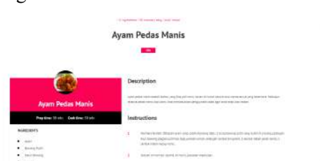
Gambar 6. Halaman Resep Makanan