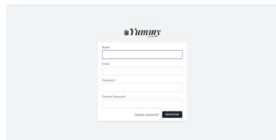
Gambar 2. Halaman Registrasi/Daftar

Gambar 2 dibawah ini adalah halaman daftar/register bagi pengguna baru yang belum memiliki akun.