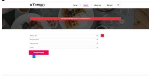
Gambar 4. Halaman Pencarian

Setelah melakukan pencarian, pengguna akan diberi tampilan halaman hasil pencarian resep makanan pada gambar 5.