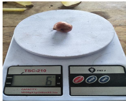
Gambar. Bawang merah dengan berat 6 gram

Dalam pengujian alat ini pertama kita siapkan peralatan yang akan digunakan Memasang van belt pada pulley, Memasang instalasi arus DC yang digunakan sebagai penggerak utama, Menyiapkan tacometer untuk menentukan RPM yang diinginkan, Menyiapkan stopwatch untuk mengetahui berapa lama proses perajangan, Setelah itu posisikan saklar pada posisi on, Atur kecepatan motor menggunakan DC speed controller, Masukkan bawang merah yang sudah dalam kedaan terkupas dan sudah dicuci, Selanjutnya kita melakukan pengujian alat perajang bawang merah yang diharapkan bisa mencapai kapasitas 1 kg / menit