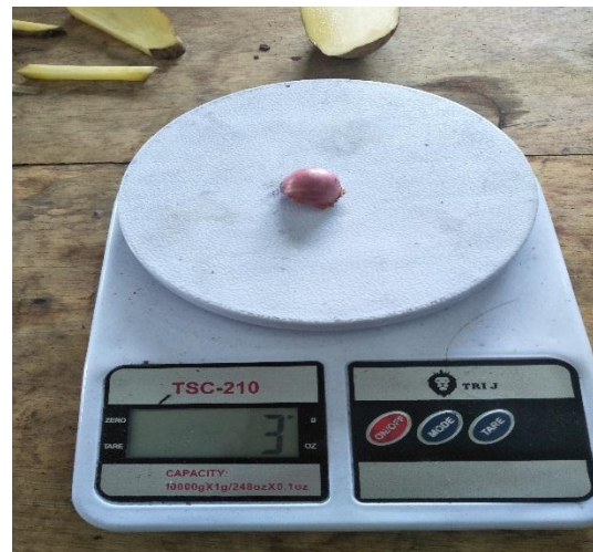
Gambar. Bawang merah dengan berat 3 gram