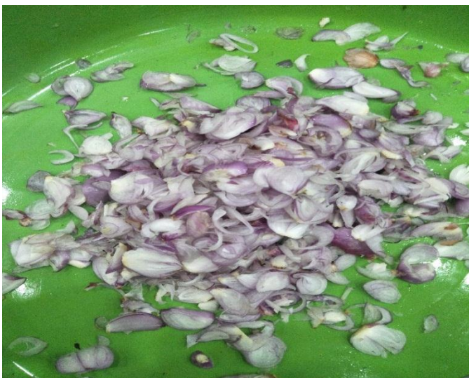
Gambar. Gambar bawang merah yah telah dirajang

Hasil pengujian pada alat pemotong bawang merah juga tergantung pada ukuran diameter besar kecilnya bawang merah yang akan dirajang. Dapat disimpulkan bahwa ukuran bawang merah memiliki peran penting dalam banyaknya jumlah irisan bawang merah. Semakin besar ukuran diameter bawang merah maka semakin banyak jumlahnya, dan semakin kecil ukuran diameter bawang merah maka semakin sedikit jumlahnya dengan tebal sama yaitu 1 mm.