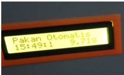
Gambar 3.2 Pengujian RTC

Pengujian RTC ini bertujuan untuk mengetahui apakah RTC dapat menampilkan waktu saat itu serta bekerja secara baik atau tidak, sehingga dapat digunakan sebagai penjadwalan dalam pemberian pakan konsentrat untuk sapi, hasil pengujian dapat dilihat pada gambar 3.3 berikut :