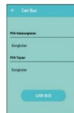
Gambar 3. Pencarian Bus

Pada menu menu ini terdapat ketika pengguna memilih pilihan menu pencarian bus pada menu utama, di sub menu ini