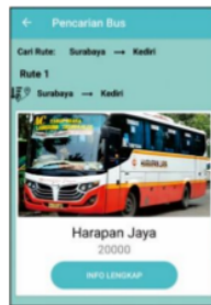
Gambar 4. Hasil Pencarian Bus

Pada halaman ini, akan ditampilkan setelah pengguna berhasil ketika setelah mengisi data kota keberangkatan dan kota tujuan di menu pencarian bus.