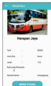
Gambar 5. Info Lengkap

Pada halaman info lengkap ini, terdapat ketika pengguna memilih bus pada halaman pencarian bus.