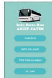
Gambar 2. Menu Utama

dimana dalam menu ini terdapat 4 pilihan menu yang dapat dipilih oleh pengguna.